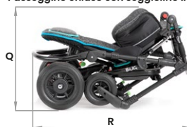
Passeggino chiuso con seggiolino inserito