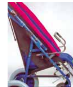
839 - Appoggiamani Cod. ISO 18.09.39.154