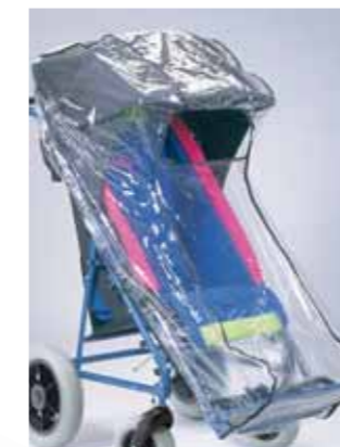
825 - Sacca parapoggia , utilizzabile solo con la cappottina 819