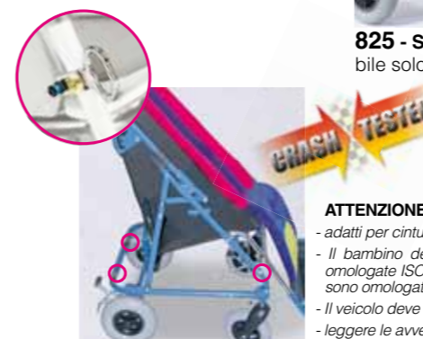
891 - Ancoraggi (4 anelli) per il trasporto, in direzione del senso di marcia, su veicoli in movimento (auto private, bus ecc..)