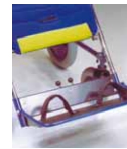
827 - Cinturini fermapiedi Ricond. al Cod. ISO 12.27.03.130