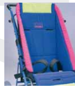
817 - Fasce inguinali