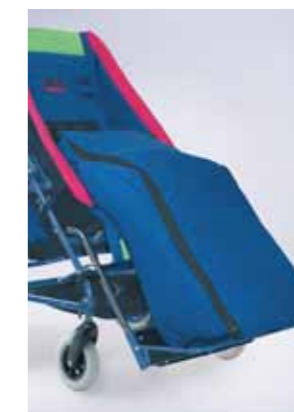
818 - Sacca termica