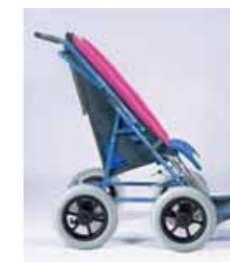
833 - Base alternativa con ruote da 12 cm