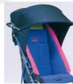
819 - Cappottina