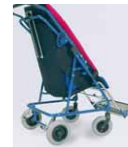
832 - Base alternativa per passaggi e ascensori stretti (riduce la larghezza esterna di 7 cm). Ruote imperforabili e leggere, scorrevoli su cuscinetti a sfera, posteriori da cm 20, anteriori da cm 17