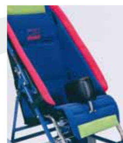
834 - Divaricatore imbottito Ricond. al Cod ISO 12.27.03.118