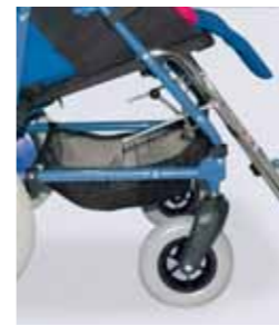
858 - Cestino in rete