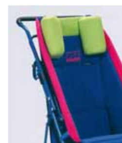
835 - Poggiatesta con protezioni parietali Cod. ISO 12.27.03.133

Costituito da due elementi laterali, utilizzabili anche singolarmente (solo a destra o solo a sinistra). Capovolgendoli varia la posizione in altezza.