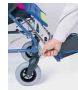
812 - Direziontori ruote anteriori Ricond. al Cod. ISO 12.06.09.145