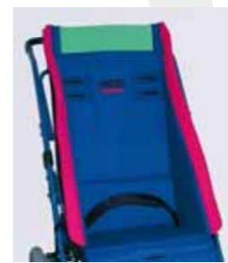
894 - Cinghia pelvica a 45° per bacino Cod. ISO 18.09.39.163