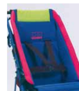
853 - Cinghia a bretellaggio Cod. ISO 12.27.03.115

Costituito da due elementi laterali, utilizzabili anche singolarmente (solo a destra o solo a sinistra). Capovolgendoli varia la posizione in altezza.