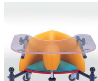
824 - tavolo trasparente con incavo Ric. al Cod. ISO indicativo 12.06.09.136